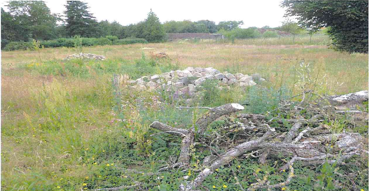
Entwicklung von angrenzenden Wiesenflächen mit offenen Steinschüttungen, Stand Juni 2020