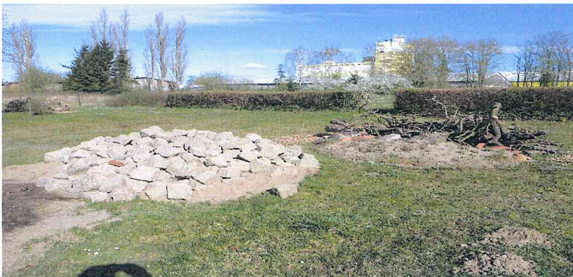
Detail Holzstapel und Steinschüttung, Stand 26.03.2020