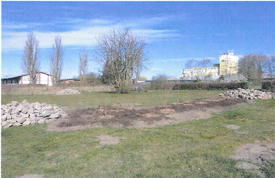
Gesamtanlage, Stand 26.03.2020