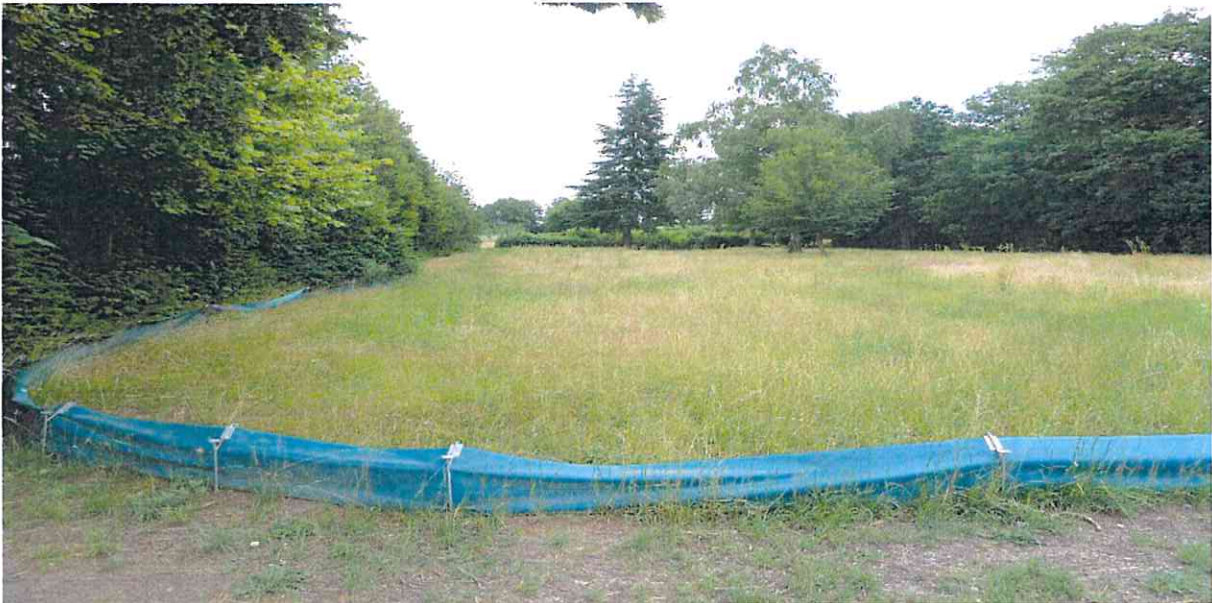
Aufstellung Schutzzaun an befahrbarem Wirtschaftsweg