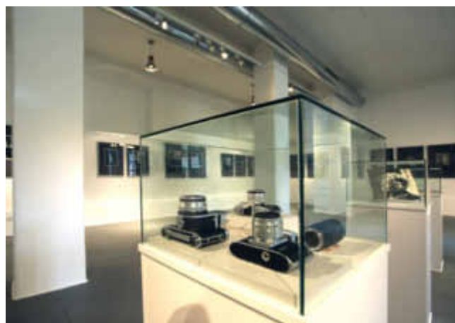
Städtische Galerie Wollhalle, Blick in die Ausstellung

Der Künstler selbst äußert sich über seine Porträt-Fotografie wie folgt: „Am Menschen bewundere ich seine schöpferischen Kräfte. Mithilfe der Fotografie kann es gelingen, Erscheinung und Wesen des Individuums wirkmächtig ins Bild zu setzen.“