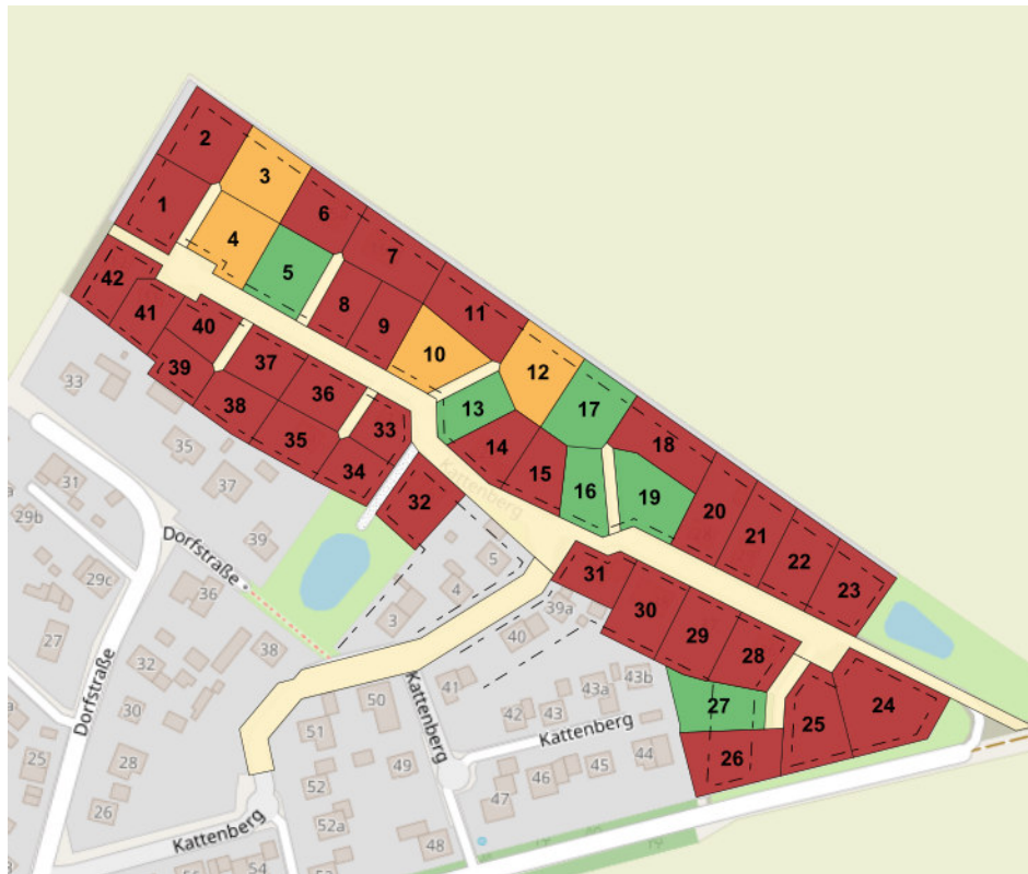
Karte Suckower Tannen (rot – verkauft / orange – reserviert / grün – frei)

Die Baugrundstücke im Baugebiet „Suckower Tannen“ befinden sich im Bereich der rechtskräftigen Bebauungspläne Nr. 6a und 6b. Der Festpreis beträgt 100,00 €/qm. Eine Vergabe zum Festpreis von 95,00 €/m 2 kann an Familien mit einem Kind unter 14 Jahren erfolgen. Für jedes weitere Kind unter 14 Jahren reduziert sich dieser Festpreis um jeweils 5,00 €/m 2 . Voraussetzung dafür ist, dass die berücksichtigten Kinder ihren Wohnsitz auf dem zu erwerbenden Grundstück nehmen werden. Der Erwerb wird an eine Bauverpflichtung innerhalb von 5 Jahren geknüpft. Es ergeht zusätzlich der Hinweis, dass nach Auskunft des Landesamtes das Grundstück voraussichtlich noch auf einer kampfmittelbelasteten Fläche liegt, die vor einer möglichen Bebauung eine bauherrenseitige Beräumung erfordert.