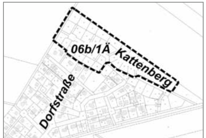
Übersichtsplan: Geltungsbereich der 1. Änderung des Teilbebauungsplans Nr. 6b - Suckow 1 - Suckower Tannen

Von der frühzeitigen Öffentlichkeitsbeteiligung gemäß § 3 BauGB wird abgesehen (§ 3 Abs. 1 Satz 3 Nr. 1 BauGB).