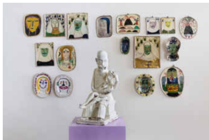
Hermann Grüneberg, Mission , 2022, Keramik © VG Bild-Kunst, Bonn 2022; Foto: Tom Dachs

In einer umfangreichen Sonderausstellung bringen die Ernst Barlach Museen Güstrow zehn renommierte junge zeitgenössische Künstlerinnen und Künstler zusammen, in deren Schaffen die menschliche Figur ein wesentliches Element darstellt. Rund 50 eindringliche Arbeiten aus den Bereichen Bildhauerei, Malerei, Grafik und Videokunst treten in einen spannungsvollen Dialog mit ausgewählten Werken Barlachs. Es entstehen überraschende Begegnungen, die die Aufmerksamkeit auf unmittelbare politische und soziale Themen richten, normative Geschlechterrollen hinterfragen aber auch ungeahnte Perspektiven auf das vielschichtige Œuvre Ernst Barlachs eröffnen.