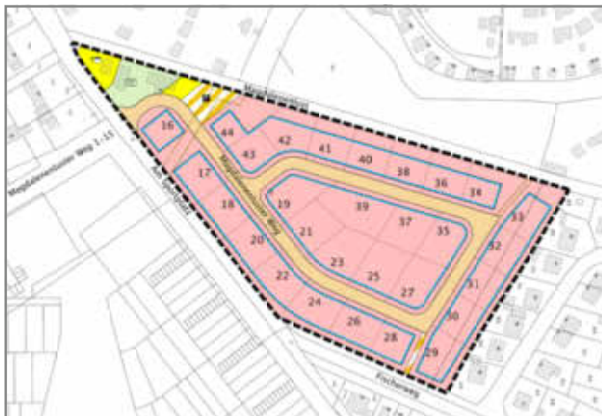
Übersichtsplan Wohngebiet am Fischerweg (Bebauungsplan Nr. 91) mit Hausnummern

Mit den Erschließungsarbeiten für das neue Wohngebiet wurde bereits begonnen. Die Vermarktung der Grundstücke soll noch in diesem Jahr beginnen.