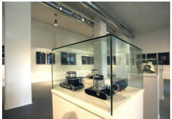
Städtische Galerie Wollhalle, Blick in die Ausstellung

Der Künstler selbst äußert sich über seine Porträt-Fotografie wie folgt: „Am Menschen bewundere ich seine schöpferischen Kräfte. Mithilfe der Fotografie kann es gelingen, Erscheinung und Wesen des Individuums wirkmächtig ins Bild zu setzen.“