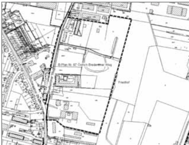
Plangebietsabgrenzung des Bebauungsplanes Nr. 67 – Östlich Bredentiner Weg – 1. Änderung

Die Stadtvertretung der Barlachstadt Güstrow fasst in ihrer Sitzung am 09.07.2015 gemäß § 2 (1) i. V. m. § 13a BauGB den Aufstellungsbeschluss für die 1. Änderung des Bebauungsplanes Nr. 67 - Östlich Bredentiner Weg. Das Plangebiet der 1. Änderung ergibt sich aus dem Übersichtsplan (Anlage 1), der Bestandteil dieses Beschlusses ist. Ziel der 1. Änderung ist es, die Gewerbegebiete als Mischgebiete und die eingeschränkten Gewerbegebiete als Wohngebiete zu entwickeln.