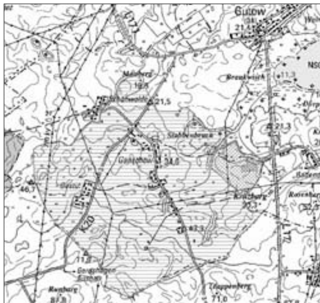
Gebietskarte zum Teilungsbeschluss im Bodenordnungsverfahren „Ganschow“