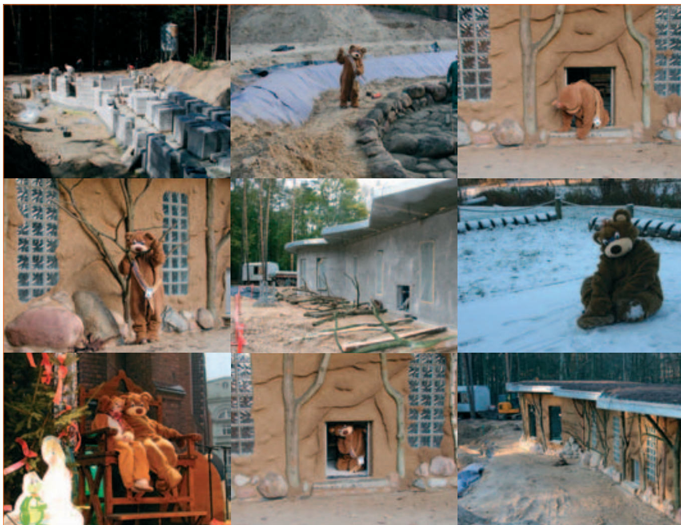
Bärenstark - Der Natur-Tierpark Güstrow, Eröffnung pünktlich zum Saisonbeginn 2006