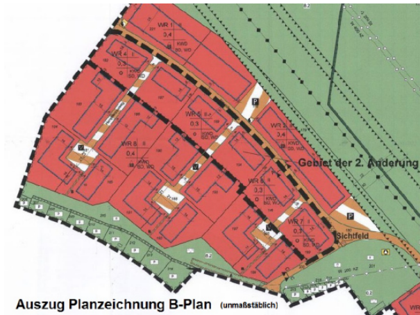
Auszug Planzeichnung B-Plan (unmaßstäblich)

Für die im Plan rot markierten Grundstücke wurden bei der jetzigen Ausschreibungsrunde Gebote abgegeben. Die blau markierten Grundstücke sind noch verfügbar.